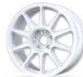
new Fullrace Rally A FF