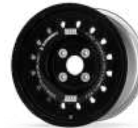
Formrace R sixteen