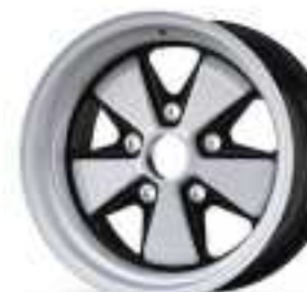
BZ RSR Finish