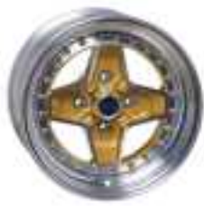
SERIE 2 RC