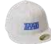
Light grey cap / Gorra gris claro