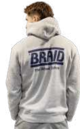
Light grey hoodie / Sudadera gris claro