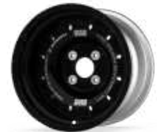
Formrace R twelve