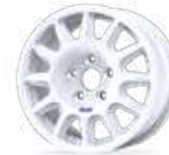
new Fullrace Rally T