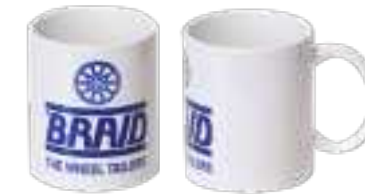
Ceramic mug / Taza de cerámica