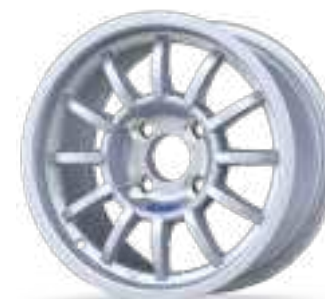
Winrace A 13"