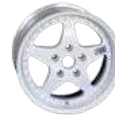
SERIE 6 FR