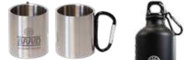
Metallic mug / Taza metálica