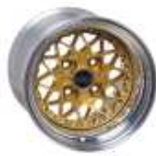
SERIE 4 RC