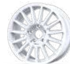
Winrace A 16"