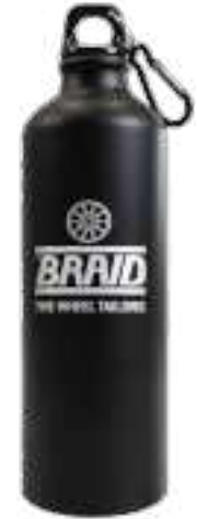
Water bottle / Botella de agua