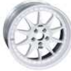
SERIE 1 FR