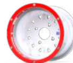
Tenrace+ Beadlock B

Price for beadlock ring in red colour. / Precio para aro beadlock en color rojo.