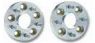
DOUBLE CENTERING AND DOUBLE FIXING SPACERS

Unit price. Bolting included. / Precio unitario. Tornillería incluida. For other thickness ask for prices. / Consultar precios para otros gruesos.