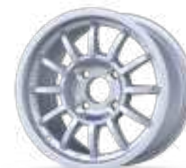
Winrace A 13"

OTHER WHEEL WIDTHS ALSO AVAILABLE IN OPTIONS SECTION / OTROS ANCHOS DE LLANTA DISPONIBLES EN LA SECCIÓN OPCIONES