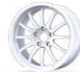
Forged RX (lip)