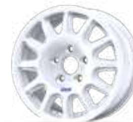
new Fullrace Rally T

Consulte la SECCIÓN DE OPCIONES para otros desplazamientos, distintos colores y más.