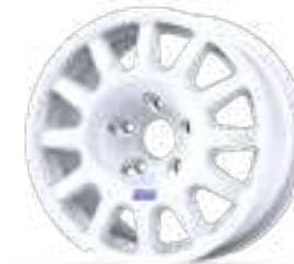
Fullrace T Acropolis