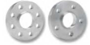
DOUBLE CENTERING SPACERS

Unit price. Bolting not included. / Precio unitario. Tornillería no incluida. For other thickness ask for prices. / Consultar precios para otros gruesos.