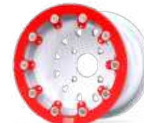
Tenrace+ Beadlock A