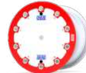
Tenrace+ Beadlock A (mud cover)