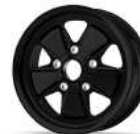
BZ Painted rim