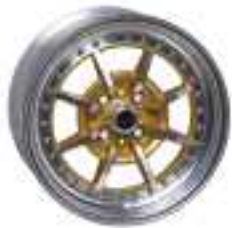
SERIE 1 RC