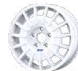
Winrace N Lars