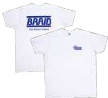
White t-shirt / Camiseta blanca