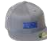
Dark grey cap / Gorra gris oscuro