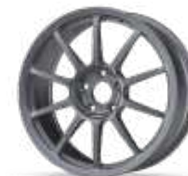
Forged I Rally

Prices include standard Motorsport wheel finish, including steel washers, specified standard colours; excluding centre cap. Refer to the ACCESSORIES SECTION for available centre cap options.