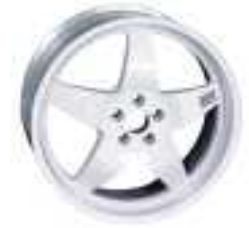
SERIE 6 FMR