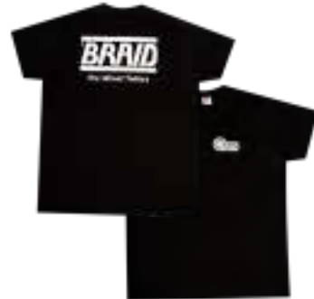
Black t-shirt / Camiseta negra