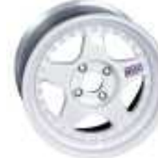
SERIE 6 R