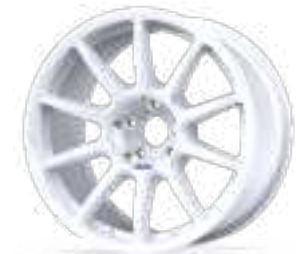
new Fullrace AC FF

OTHER WHEEL WIDTHS ALSO AVAILABLE IN OPTIONS SECTION / OTROS ANCHOS DE LLANTA DISPONIBLES EN LA SECCIÓN OPCIONES