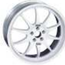
SERIE 1 FMR