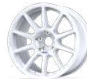
new Fullrace AC FF