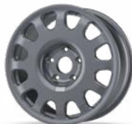
Forged GT 4x4