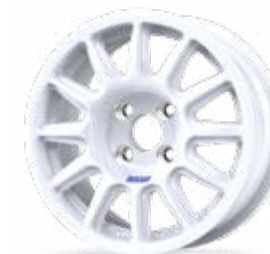
new Fullrace Rally-T 14"

Consulte la SECCIÓN DE OPCIONES para otros desplazamientos, distintos colores y más.