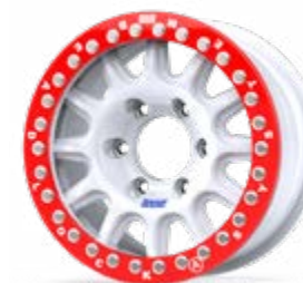
new Fullrace Rally-T

Consulte la SECCIÓN DE OPCIONES para otros desplazamientos y más.