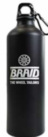
Water bottle / Botella de agua