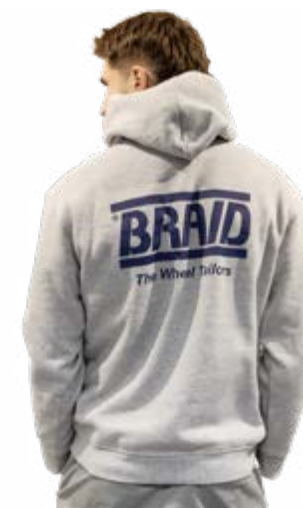
Light grey hoodie / Sudadera gris claro