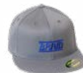
Dark grey cap / Gorra gris oscuro