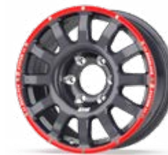
Fullrace T Dakar