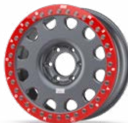
Forged GT 4x4