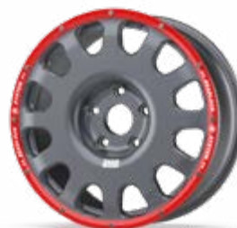
Forged GT 4x4