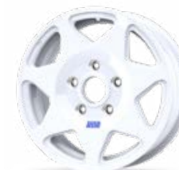
Forged Dakar Classic

OTHER WHEEL WIDTHS AND DIAMETERS ALSO AVAILABLE. ASK / OTROS ANCHOS Y DIÁMETROS DE LLANTA TAMBIÉN DISPONIBLES. CONSULTAR