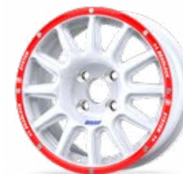
new Fullrace Rally-T 14"

Los precios incluyen cualquier color estándar en la pestaña Beadlock B. Para colores especiales, otros desplazamientos y más consulta la SECCIÓN DE OPCIONES.