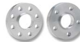
DOUBLE CENTERING SPACERS