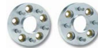
DOUBLE CENTERING AND DOUBLE FIXING SPACERS

Unit price. Bolting included. For other thickness ask for prices. / Precio unitario. Tornillería incluida. Consultar precio para otros gruesos.