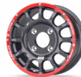
Fullrace B Dakar