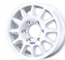
Fullrace Rally-T 15"