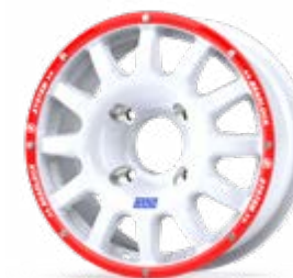
Fullrace T Acropolis