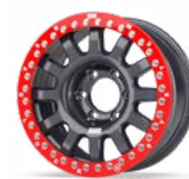
Fullrace T Dakar