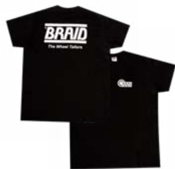
Black t-shirt / Camiseta negra