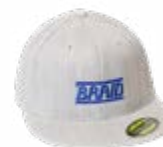
Light grey cap / Gorra gris claro