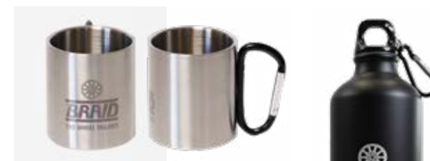
Metallic mug / Taza metálica