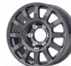
Fullrace T Dakar