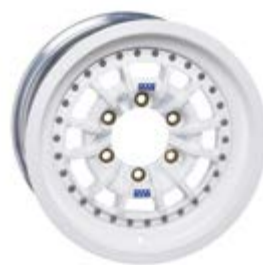
Serie 1 4X4

a/s= Prices according specs. / a/s= Precios según características.