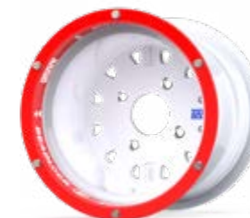
Tenrace+ Beadlock B