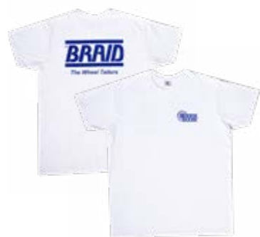
White t-shirt / Camiseta blanca