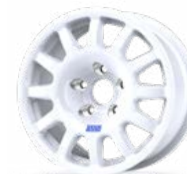
Fullrace T Acropolis