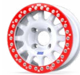
Fullrace T Acropolis