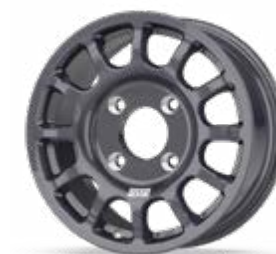
Fullrace B Dakar