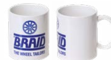
Ceramic mug / Taza de cerámica