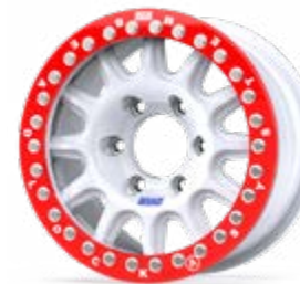
new Fullrace Rally-T