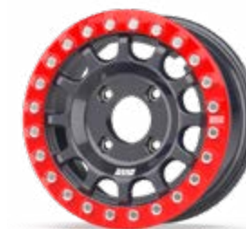
Fullrace B Dakar